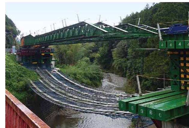
自社作成手延べ機使用